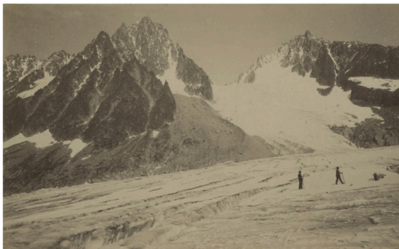
Joseph Vallot en expédition.

Avec son cousin Henri, il se lance ensuite dans un travail cartographique inédit et titanesque : une carte au 1/20 000 e du massif du Mont-Blanc, obtenue par triangulation et relevés photographiques. Un véritable chef-d'œuvre de précision, achevé et publié après leurs morts par le fils d'Henri, Charles, qui publia le Guide Vallot en 1925.