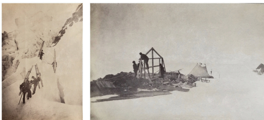
Construction de l'observatoire du Mont-Blanc en 1890.

Riche de ses expériences de terrain, Vallot comprend qu'il ne peut pas construire son laboratoire au sommet même du Mont-Blanc : ses études de glaciologie lui ont révélé que les glaces de la calotte sommitale engloutiraient inévitablement toute structure. Son regard se porte alors sur l'arête des Bosses, où émerge un monticule rocheux capable d'accueillir scientifiques et alpinistes — car pour Vallot, les deux sont indissociables. La science qu'il pratique là-haut ne pourrait exister sans l'alpinisme, et il tient à ce que guides et grimpeurs puissent eux aussi bénéficier d'un refuge à cette altitude. C'est ainsi qu'à l'été 1890, après que Vallot ait convaincu la mairie et finement peaufiner les plans, la cabane voit le jour, après seulement 15 jours de construction. Ce sont pas moins de 35 ouvriers et 110 porteurs, guides et scientifiques, qui participeront à la construction de ce bâtiment mythique.