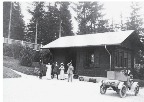
Le chalet qui abrite le laboratoire de la vallée, actuel "Observatoire du Mont Blanc", à Chamonix Mont-Blanc. Les Amis du Vieux Chamonix.

Joseph Vallot inspire encore aujourd'hui la science au Mont-Blanc et notamment les scientifiques du Centre de Recherche sur les Écosystèmes d'Altitude (CREA Mont-Blanc). Autour des enjeux de biodiversité et de changements climatiques, le CREA Mont-Blanc bâtit un pont entre science et société. Il génère des connaissances en écologie alpine, selon une méthode et des protocoles scientifiques rigoureux, et sensibilise le grand public. Ses chercheurs et chercheuses privilégient l'observation de terrain, les suivis long-terme, et appréhendent le massif dans toutes ses altitudes, répétant les mêmes protocoles à différents étages pour mieux comprendre l'évolution de sa faune et de sa flore. Tout comme Joseph Vallot, ils mêlent tradition naturaliste et usage des technologies et instruments les plus modernes : satellites, pièges photos ou encore intelligence artificielle. Citoyens, professionnels de la montagne et décideurs sont associés à cette production scientifique, via une démarche de science participative, et bénéficient des derniers savoirs scientifiques accessibles et vulgarisés.