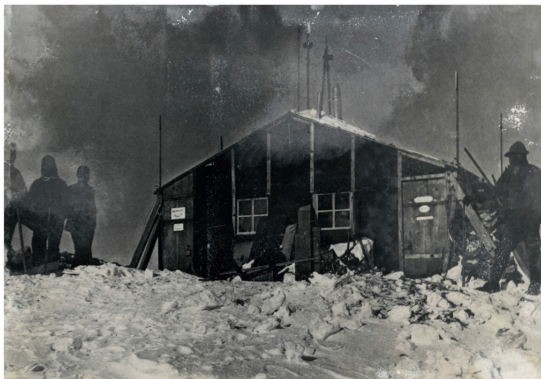
L'observatoire dans son état d'origine en 1890. Il ne mesure alors que 3 mètres sur 5 et compte deux pièces, l'une pour les savants, l'autre pour les guides et les touristes.