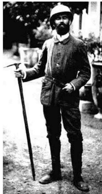
Joseph Vallot pour la "Revue Illustrée" du 15 juillet 1904.

Les archives de la Bibliothèque nationale de France, du Club alpin français et ses carnets d'enfance dressent le portrait d'un esprit à la fois brillant et vagabond, peu enclin à rester assis face à des abstractions, mais doté d'une intelligence rare et de capacités physiques remarquables.